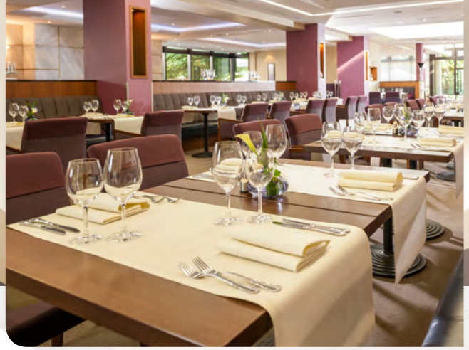
Dorint - Main Taunus Zentrum - Frankfurt/Sulzbach - Kapazitäten der Tagungsräume/Meeting Room Capacity